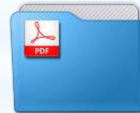
Письмо фонда "Стажировочная площадка"