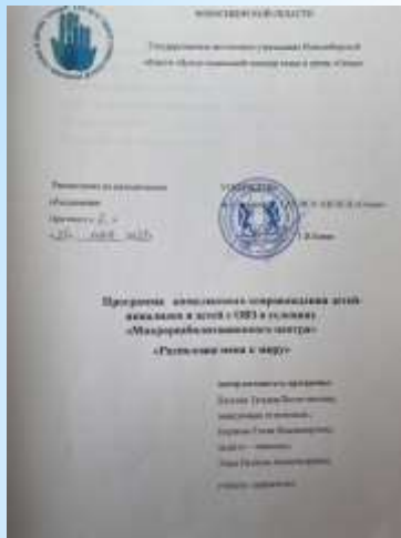
Программа «Расположи меня к миру»