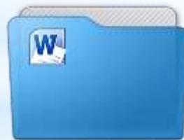
Паспорт стажировочной площадки фонда