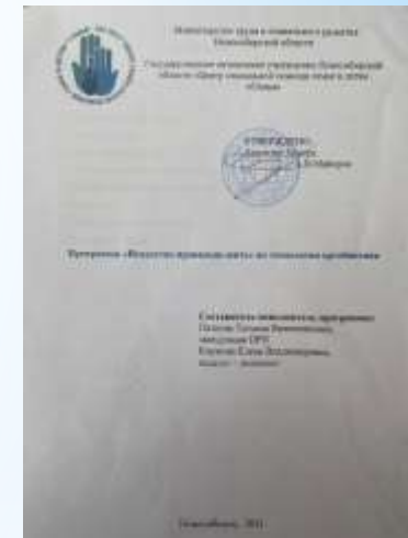
Программа «Искусство правильно жить» по технологии ортобиотика.