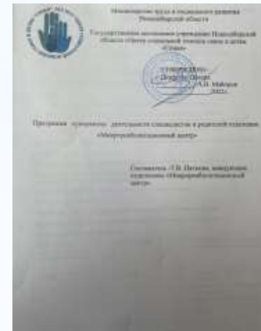
Программа супервизии деятельности специалистов и родителей.