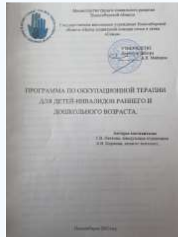
Программа по оккупационной терапии для детей- инвалидов раннего и дошкольного возраста